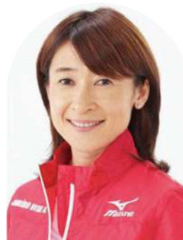
マラソンランナー・ MariCompany代表取締役 谷川 真理さん